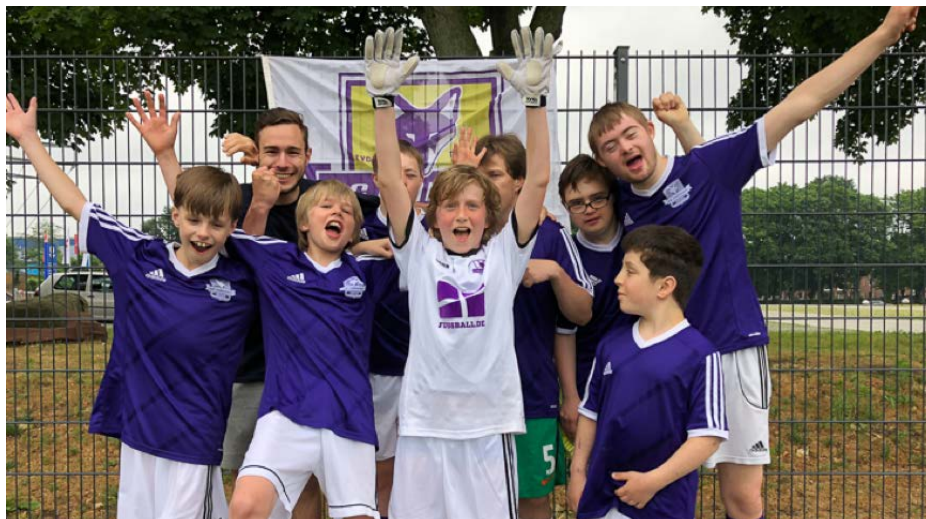
Das inklusive Team der SG Findorff beim FußballFreunde-Cup Nord

Seit fast 10 Jahren begleitet Christoph Schlobohm Menschen mit Beeinträchtigung in ihrer Freizeit, bei der Arbeit oder in der Schule. Zudem hat er einige Jahre Jugendmannschaften und für zwei Jahre die