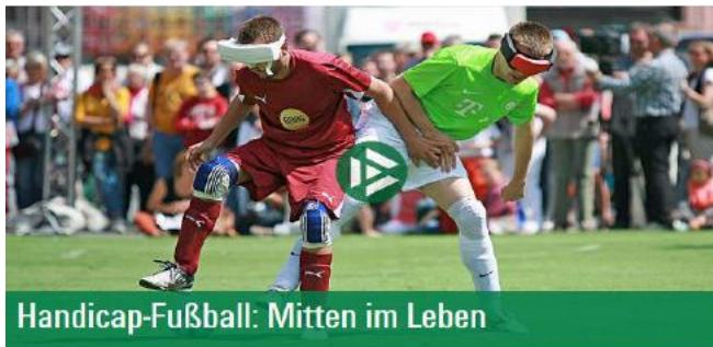
Handicap-Fußball: Mitten im Leben

Der DFB hat diesen neuen Bereich zum Thema "Handicap-Fußball" eingerichtet. Er ist unterteilt nach den Themen Blindenfußball, Werkstattfußball, Integrative Spielformen, CP-Fußball, Amputierten-Fußball, Gehörlosenfußball, Rollstuhlfußball, Sitzfußball. Informiert wird über Regeln, Verbreitung, Spielmöglichkeiten sowie Wettbewerbe im Fußball für Menschen mit Behinderung. Darüber hinaus gibt es dort die aktuelle Liste der Inklusionsbeauftragten der Landesverbände sowie eine Online-Börse. Hier können Vereine oder auch Werkstätten Fußballturniere einstellen und dafür werben. Behinderte Menschen können so außerdem nach einer nahe gelegenen Spielmöglichkeit suchen.